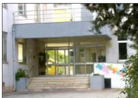
Scuola Secondaria di I° grado "Gennaro Venisti"