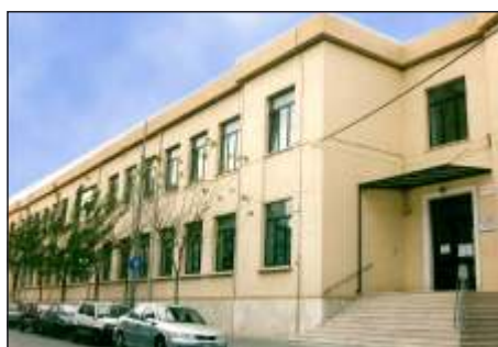
Scuola Primaria "San Giovanni Bosco"