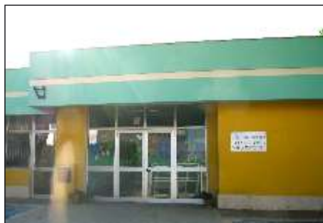
Scuola Infanzia "Maria Montessori"