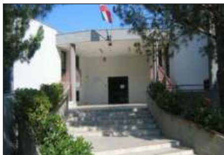
Scuola Primaria "San Domenico Savio"