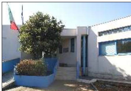
Scuola Infanzia "Madre Teresa di Calcutta"