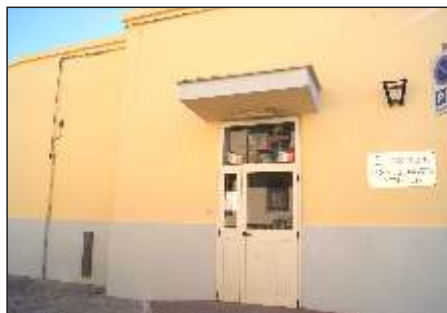
Scuola Infanzia "Giovanni Rodari"